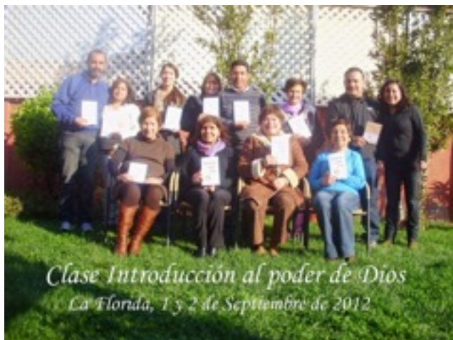
Clase Introducción al poder de Dios La Florida, 1 y 2 de Septiembre de 2012

Durante el primer fin de semana de septiembre se presentó una clase Introducción al poder de Dios en La Florida, RM.