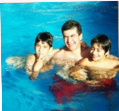
ÁREA DE LA PISCINA

Santiago 5:11 Fíjense que llamamos felices a aquellos que fueron capaces de perseverar. Han oído de la constancia de Job, y saben lo que al final el Señor hizo por él, pues el Señor es compasivo y misericordioso.