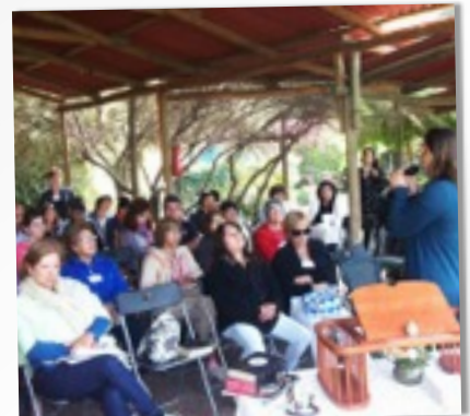
ÁREA DE ENSEÑANZAS