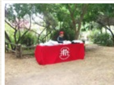
Librería ¡Ven preparado!