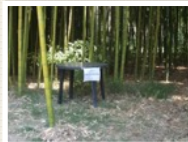
Tiempo libre para orar