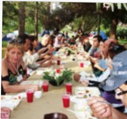
ÁREA DE COMEDORES