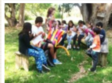
Reuniones para los niños