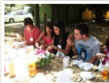
Reuniones para los jóvenes